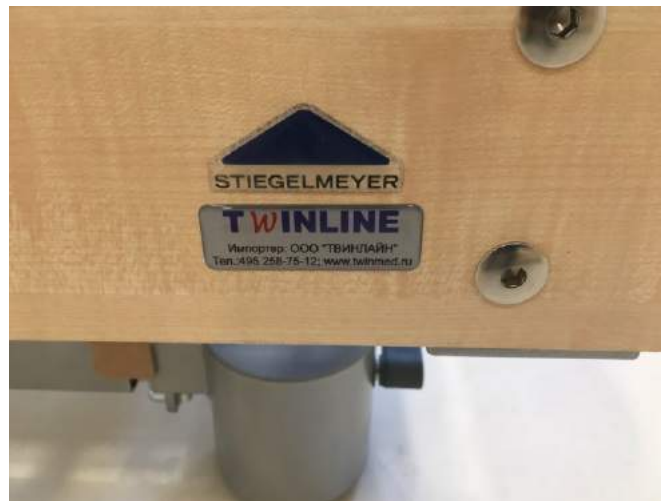
Оснащение палат в реабилитационном центре «Малаховка» 2017 г. Медицинские электрические кровати LIBRA (STIEGELMEYER, Германия)