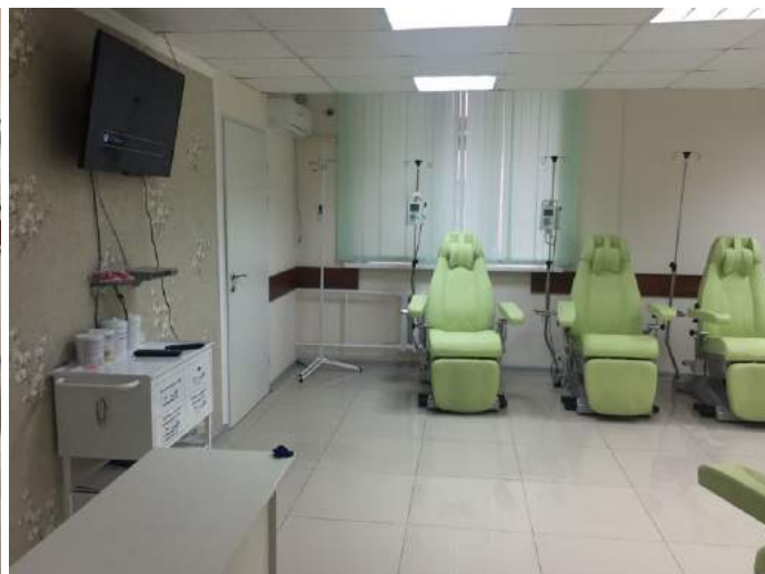
Оснащение Онкологического диспансера, г. Грозный. Многофункциональные медицинские кресла модели AP4295 (GIVAS, Италия)