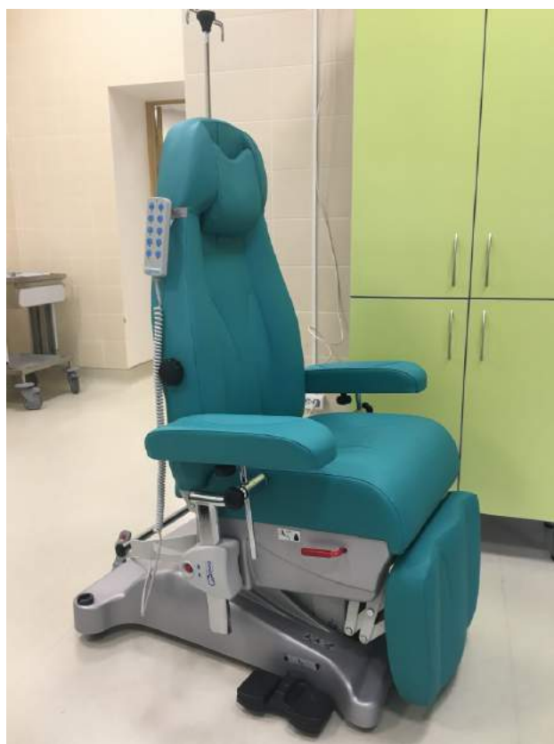
Оснащение клиник ГК «МЕДСИ», г. Москва. 2017 г. Многофункциональные медицинские кресла модели AP4295 (GIVAS, Италия)

С уважением, Генеральный директор ООО «ТВИНЛАЙН»