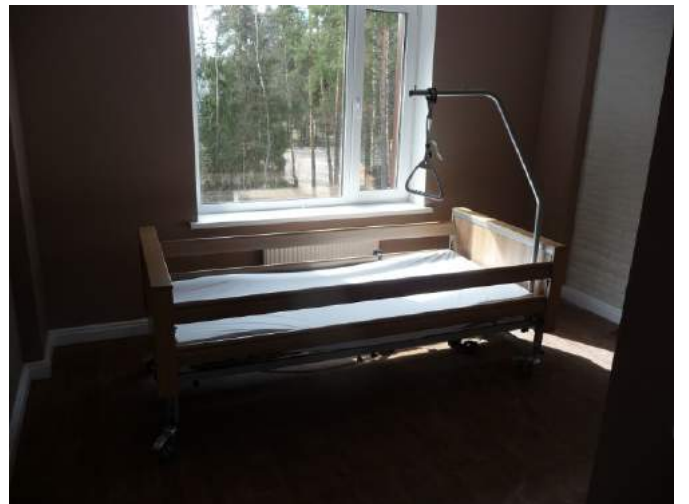
Оснащение корпуса в реабилитационном центре «Три Сестры» Московская область, г. Черноголовка. 2017 г. Медицинские электрические кровати DALI II в нестандартном цвете: рама и металлические части серебристого цвета, деревянные и пластиковые элементы в цвете “Navanna Cherry” (BURMEIER, Германия)