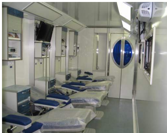
Донорские кресла модели AP4096 (GIVAS, Италия), установленные в мобильных донорских пунктах. Поставка для ФГУП «ЭПМ» ФМБА, г. Москва.