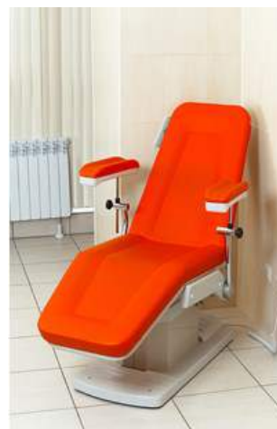
Медицинский центр «Академия здоровья». Кресло для забора крови модели AP4096 (GIVAS, Италия)