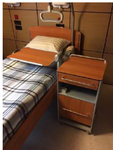
Оснащение палат в частном медицинском центре «Спутник», Санкт-Петербург 2017 г. Медицинские электрические кровати “LIBRA” и тумбочки “Soreno Eco” (STIEGELMEYER, Германия)