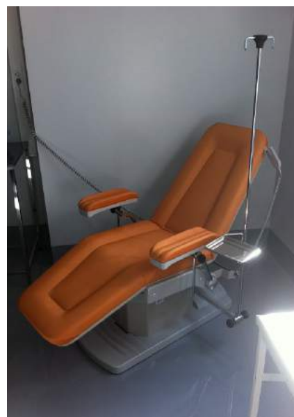
АО «Медицина», г. Москва. Кресло для забора крови AP4096 (GIVAS, Италия)