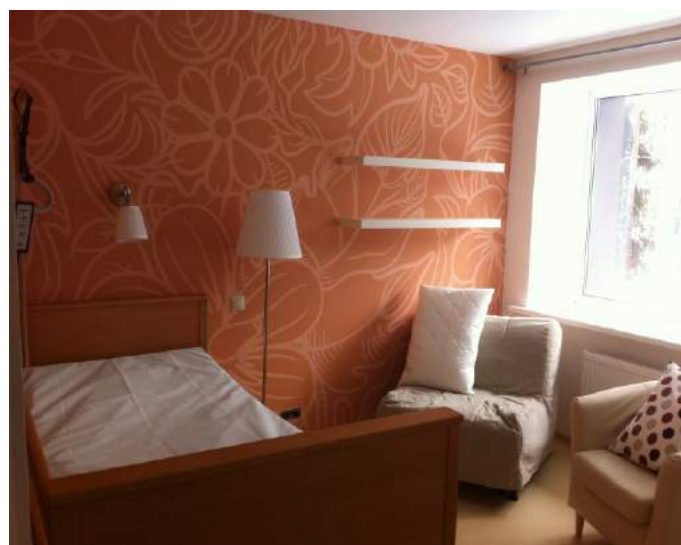
Оснащение палат в реабилитационном центре «Три Сестры». Медицинские электрические кровати DALI II (BURMEIER, Германия)