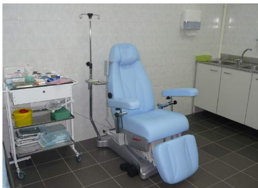
ФГУП «Научный центр «Сигнал», г. Москва. Многофункциональное медицинское кресло модели AP4295 (GIVAS, Италия)