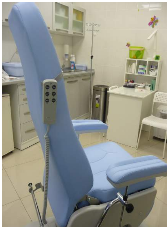
Детская клиника “Нарру”. Кресло для забора крови модели AP4095 (GIVAS, Италия)