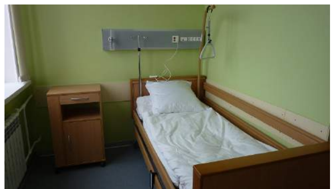
Оснащение палат в больнице скорой медицинской помощи, г. Калуга. Медицинские электрические кровати DALI II (BURMEIER, Германия)