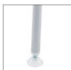
AV Каркас, окрашенный алюминиевой эпоксидной краской