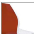
Двухцветный полипропилен. Глянцевый задний каркас спинки