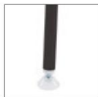
AN Черный окрашенный каркас