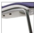
Специальный каркас для штабелирования стульев с обитыми сиденьями