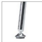
ACC Хромированный каркас