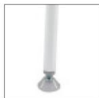
AV Белый окрашенный каркас