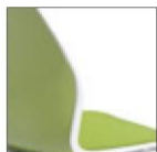
Обитое сиденье, одноцветное или двухцветное исполнение