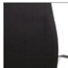
Kruna (mesh) Сиденье /спинка из ткани-сетки