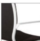
Рама и подлокотники из стали, окрашенные в белый цвет