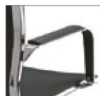
KU..P. Хромированная сталь с черным полиуретановым верхом