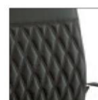
Kruna plus R «Ромбовидная» прострочка