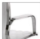
TU..T. Хромированная сталь с обитым верхом