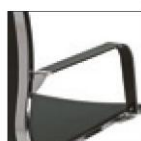
KU..C. Хромированная сталь