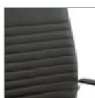
Kruna plus L «Линейная» прострочка