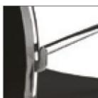
Хромированная рама с салазками