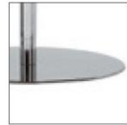
Поворотное или фиксированное круглое основание из нержавеющей стали, Ø 580 мм