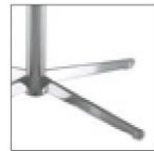
Поворотное или фиксированное хромированное основание в виде 4-х конечной звезды