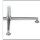
AL4 Поворотное основание из литого полированного алюминия на 4-х ножках с регулировкой высоты