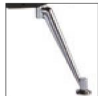
Версия с алюминиевыми ножками