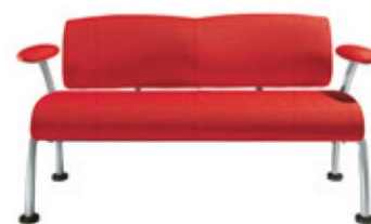
Версия с подлокотниками и ножками, окрашенными алюминиевой эпоксидной краской